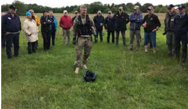
Föreläsaren på marken.

Dagen avslutades med att några Saab Draken föreläsades. En av dem startade vänligt och bullrade några minuter.