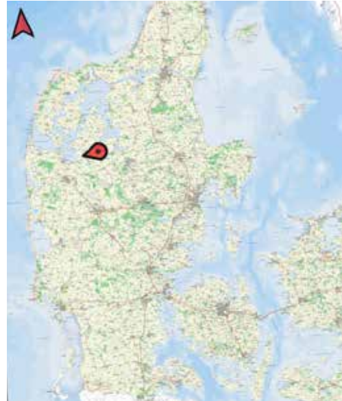
Här ligger Skive.