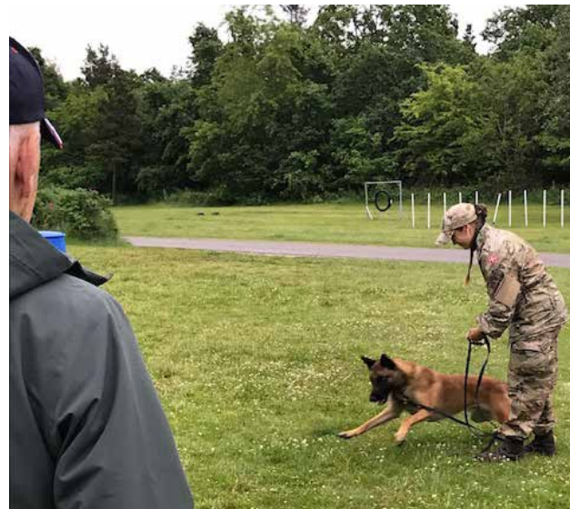
Förevisning av hundekipage.