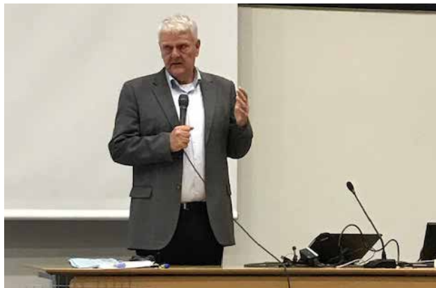
Amiralen med okänt namn.

Efter fikapaus genomfördes ett föredrag om Danmarks roll i Nato och EU av en pensionsavgången Amiral vars namn snabbt passerade revy.