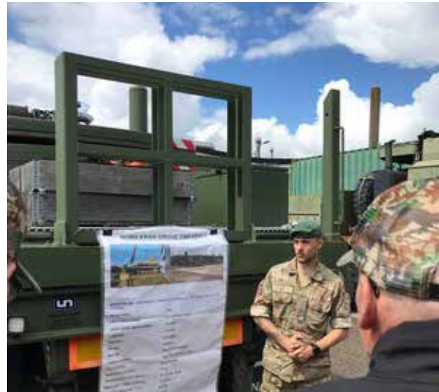
Förevisning av lyftkran.