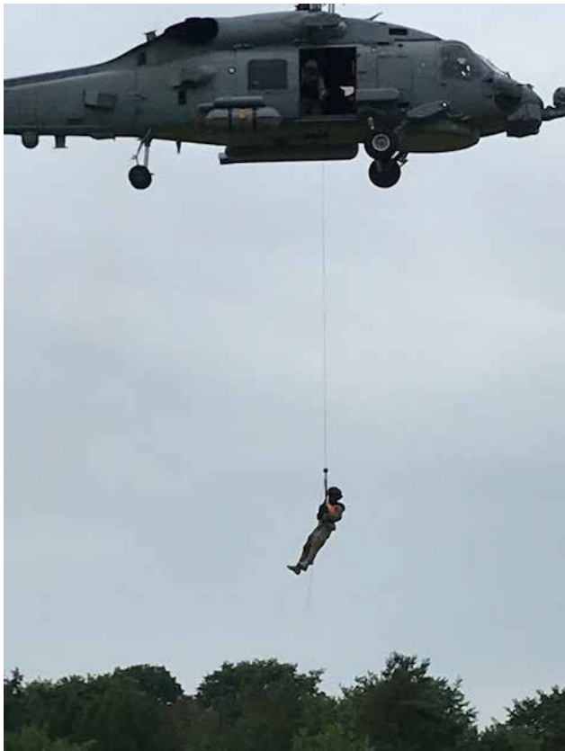
Firning av föreläsaren.

Nästa punkt i programmet var en föreläsning av Helikopterskvadronen. De inledde med att fira ner sin föreläsare som sedan berättade om deras helikoptrar samt uppgifter.