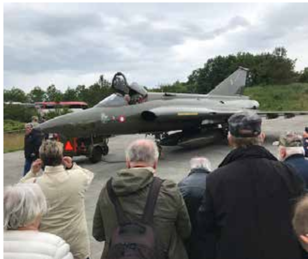
Här gäller det att ha hörselskydd.

Innan återfärd till Skive körde vi en rundtur på flygplatsen. Där vi fick se en kolossal bunker som tyskarna byggt under kriget. Engelsmännen tänkte spränga den efter kriget men kom till insikt att de skulle ödelägga ett stort område runt bunkern, flera mil. Idag används den som en ledningscentral för det Danska flygvapnet.