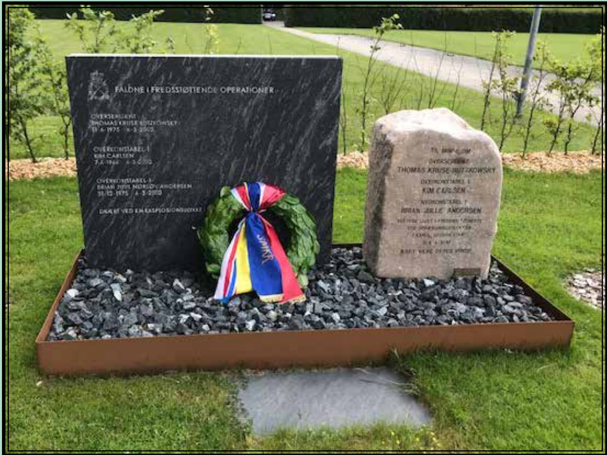
Ingenjörregementets i Skive minnessten

ORGAN FÖR SIGNALTRUPPERNAS KAMRATFÖRENING